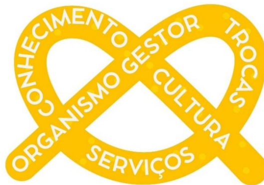
Figura 2 – Disposição pretzel do Corpo Coletivo Acolhedor

Essas dimensões engendram o funcionamento do Corpo Coletivo Acolhedor, dizendo, portanto, sobre a forma de acolher das cidades. Além disso, a estruturação do CCA pode ser representada pelo traçado de um pretzel (Figura 2), em que os vértices estão em dinâmica constante, em entrelaço. Há movimentos internos, mas igualmente observa-se a abertura para o exterior, já que as pontas não fecham, indicando, de certa maneira, uma dinâmica constante entre os vértices: cultura, serviços e gestão.